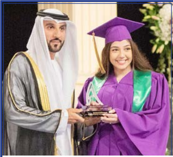
Jala Rasoul Al Mousannef Al Mawakeb Al Garhoud